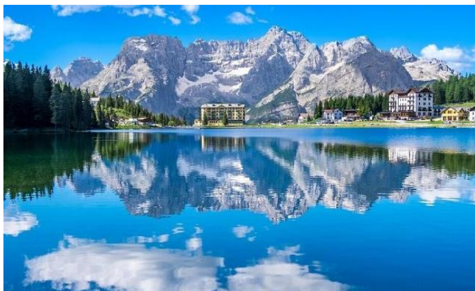
Lago di Misurina

Nastavak puta ka Lago di Misurina i obilazak jezera (2,5km). Staza je laka i dobro uređena, sa divnim pogledom na okolne vrhove. Nastavljamo do Cortine D'Ampezzo , obilazimo čuveni alpski gradić i pravimo pauzu za ručak (po želji). Vožnja do smeštaja i noćenje.