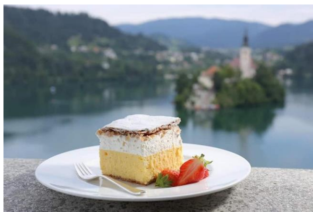
Bled & Bledska krepita