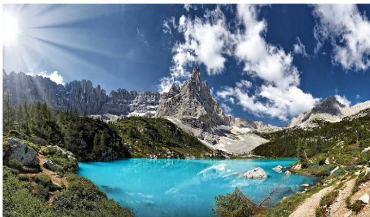
Lago di Sorapis