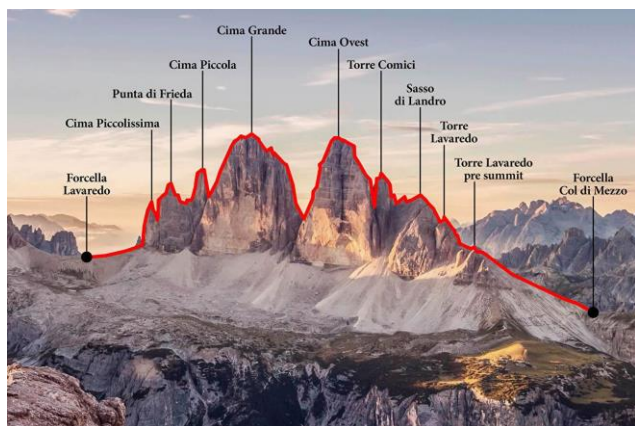
Tre Cime di Lavaredo